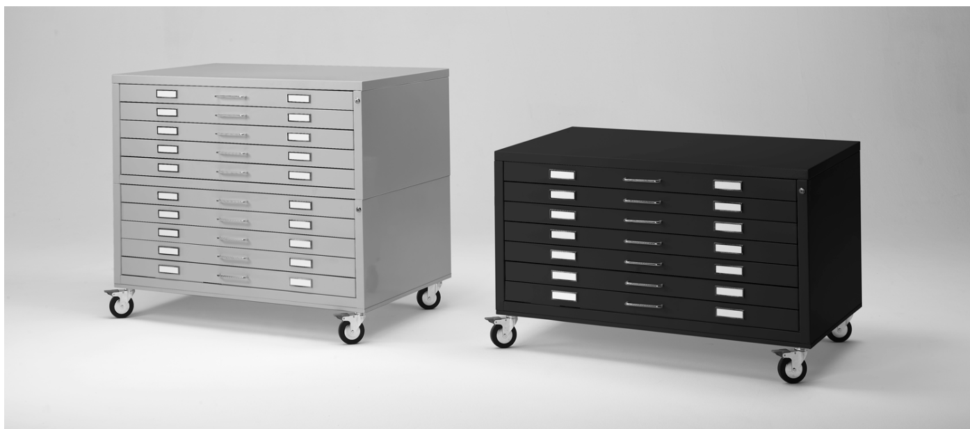
Cassettiere Draftech M200EXP Expert. Draftech drawers M200EXP Expert.