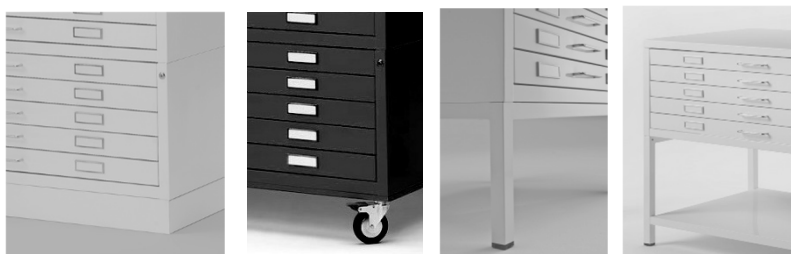
Disponibili basi a zoccolo, basi su ruote industriali, e su richiesta basi rialzate a quattro gambe o basi rialzate a scaffale.