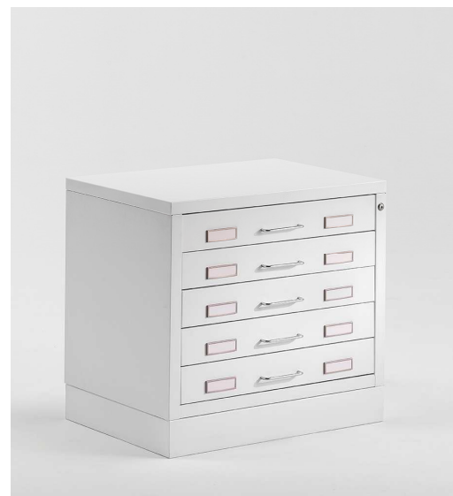
M200S Special Cassetti ad altezza maggiorata.

A0 Utile interno/Total usable cm 132x93x8,5h A0 Estrazione/Extraction cm 63 (EMME) A0 Estrazione/Extraction cm 90 (SYS) A1 Utile interno/Total usable cm 105x73x8,5h A1 Estrazione/Extraction cm 45 (EMME) A1 Estrazione/Extraction cm 70 (SYS) A2 Utile interno/Total usable cm 63x50x8,5h A2 Estrazione/Extraction cm 30 (EMME) A2 Estrazione/Extraction cm 50 (SYS)